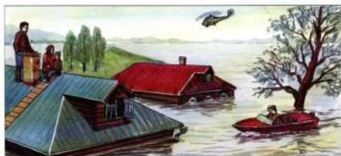
Спасти людей, где бы они ни оказались, используя для этого любые средства