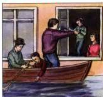
В первую очередь из зоны затопления выводить детей