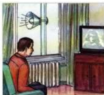
Постоянно слушать информацию об обстановке и порядке действий