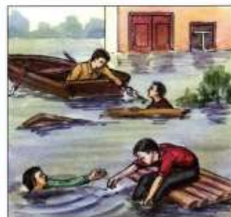
Оказывать срочную помощь людям, почувствовавшим в воде