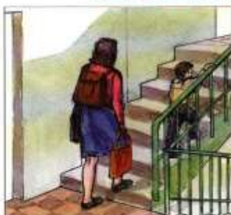
Перенести на верхние этажи продовольствие, ценные вещи, одежду, обувь