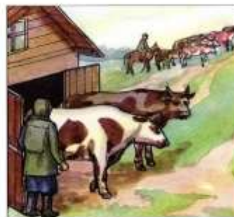
Перегнать скот на возвышенные места